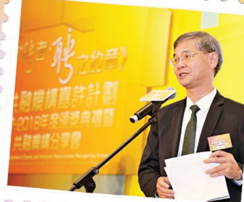
勞工及福利局局長羅致光博士，GBS，JP於《約章》計劃2017-18年度頒獎典禮暨分享會上致辭。

勞工及福利局局長羅致光博士，GBS，JP主持《有能者·聘之約章》及共融機構嘉許計劃（《約章》計劃）2017-18年度頒獎典禮暨共融機構分享會時指出，「天生我才必有用」，深信每一個人，不論健全與否，都擁有不同的潛能和才幹。只要有適當的機遇，每個人都能充分發揮才能，貢獻社會。政府非常重視殘疾人士融入社會。為了促進殘疾人士就業，政府將會繼續優化多項措施，透過不同渠道的「民、官、商」合作，因應殘疾人士的不同「能」力而加以「聘」之，讓他們有機會在不同的職場崗位上展現光芒，攜手同行，建立傷健共融社會。