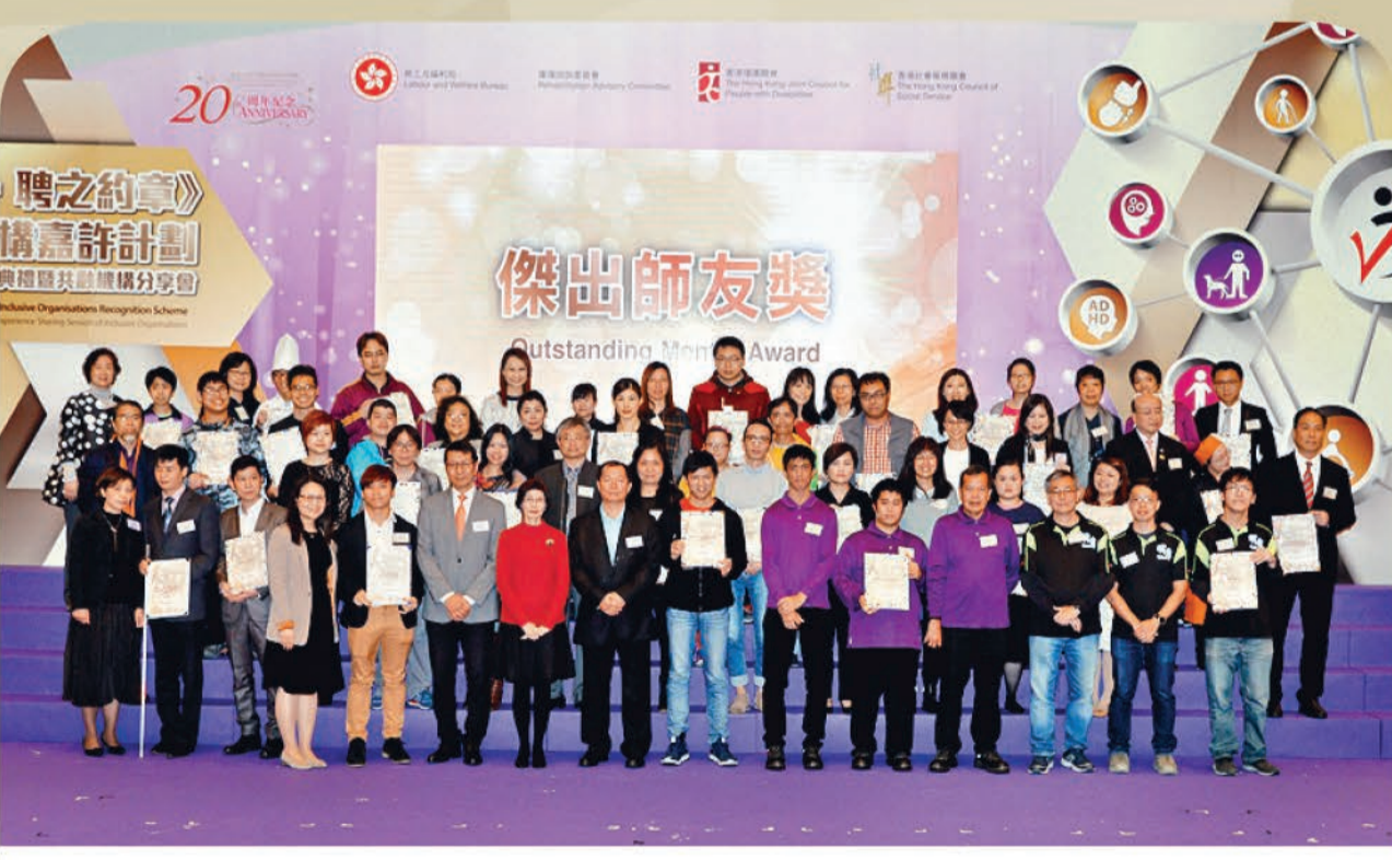
勞工及福利局常任秘書長譚贛蘭女士，JP（前左七）、香港復康聯會主席張偉良先生，BBS（前左八），及康復諮詢委員會副主席林國基醫生，JP（前左六）頒發證書予獲「傑出師友獎」的共融機構代表。

如對《約章》計劃有任何疑問，或查詢聘用殘疾人士事宜，可與勞工及福利局康復分科聯絡： 電話：2810 3874 傳真：2543 0486 電郵：charterscheme@lwb.gov.hk 網頁：www.lwb.gov.hk/charter_scheme