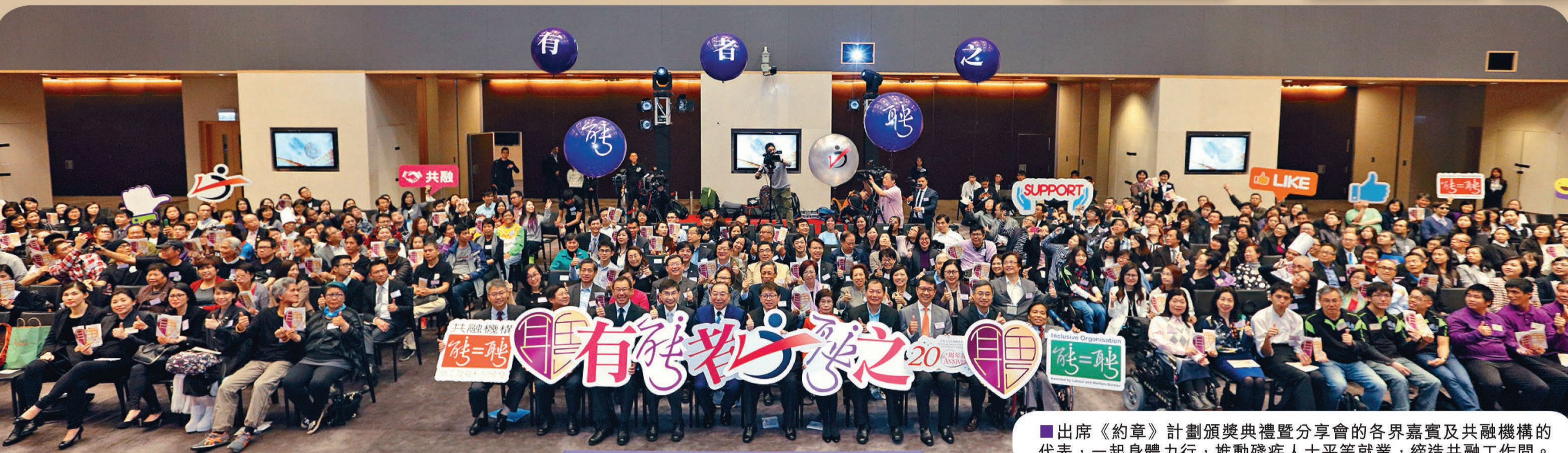
出席《約章》計劃頒獎典禮暨分享會的各界嘉賓及共融機構的代表，一起身體力行，推動殘疾人士平等就業，締造共融工作間。

勞工及福利局局長蕭偉強先生，JP 主持《有能者·聘之約章》及共融機構嘉許計劃（《約章》計劃）2016-17年度頒獎典禮暨共融機構分享會時指出，我們每個人無論貧富傷健，都有天賦的能力和權利。殘疾人士雖然在某些方面受限制，也要克服種種挑戰，但亦有自己的特長和才幹，只要給予適當的機會，就可以和你我一樣為社會作出貢獻。