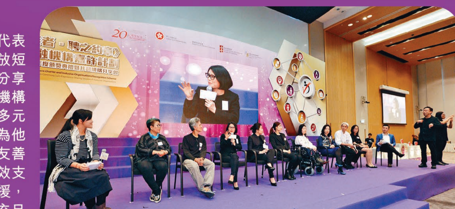
獲得「友善聘用獎」的其中三間共融機構代表和殘疾僱員（閃耀娛樂製作有限公司、活髮社有限公司及香港中華煤氣有限公司）及公務員事務局代表於頒獎典禮暨分享會上分享他們所推行的友善聘用措施。