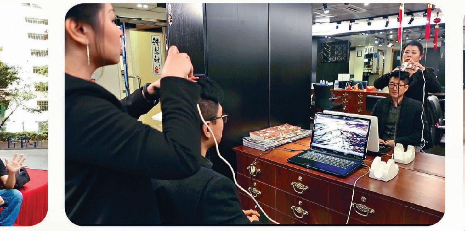
活髮社善用聾人專注和觀察能力強的特質聘請聾人任職髮型師，提供為期三個月觀察和觀察能力培訓。公司每月均安排專業導師向聾人僱員教授行業最新技術，增加髮型知識和提升技能，令她們可以在這個行業持續發展。