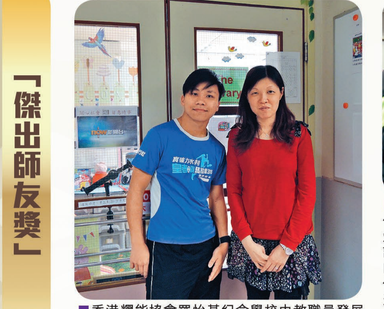
香港耀能協會羅怡基紀念學校由教職員發展組統籌「支援新教職員計劃」，不同部門的同事負責相關的培訓工作。學校安排了治療師負責培訓工作，向殘疾僱員志講解跟車工作的技巧。此外，亦安排有圖書館管理經驗的導師教導他們有關圖書館管理的工作細節。