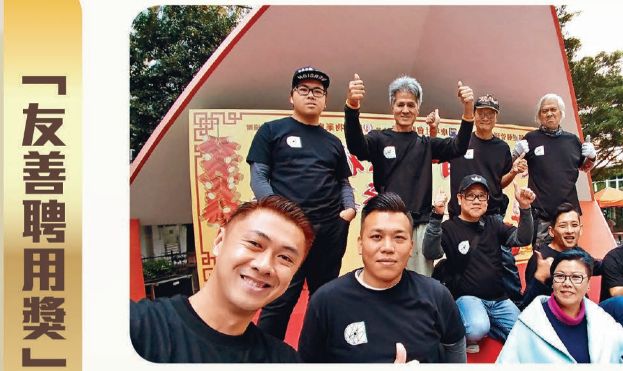
閃耀娛樂製作有限公司以「自資社會企業」模式經營，為聾人僱員提供一個持續就業的平台，亦為行業開拓人力資源。公司以「先聘用，後培訓」的方式培訓聾人從事舞台搭建、場地佈置等工作，令他們掌握較專門的技能，在職場上增加競爭力。

本年度的《約章》計劃頒獎典禮暨分享會中，獲獎機構代表應邀分享其推動殘疾人士就業的經驗。大會更在分享會中播放短片，介紹獲獎機構如何身體力行推動共融工作間的經驗，及分享他們實踐「有能者·聘之」的理念。獲得「友善聘用獎」的機構代表分享如何採取「唯才是用」的聘用政策以鼓勵集團內的多元文化，因應殘疾僱員的身體局限安排適合他們的崗位，以及為他們提供在職培訓和行業最新資訊以促進殘疾僱員持續發展的友善聘用措施；而獲得「傑出師友獎」的機構代表則分享如何有效支援殘疾員工持續就業，例如由不同組別同事給予多方面的支援，安排導師作橋樑，促進共融工作間，或為他們在工作上提供充足的指導和情緒上作出支援等。關愛僱主們均對殘疾僱員負責任、認真、守時、有禮等良好態度表示高度讚賞。透過機構代表分享成功的經驗，為在場的共融機構代表及僱主提供了更多參考資訊，務求令共融措施得以持續發展。