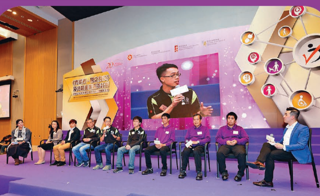
獲得「傑出師友獎」的其中三間共融機構代表和殘疾僱員（香港耀能協會羅怡基紀念學校、明愛電腦工場及天瑞禮賓服務有限公司）於頒獎典禮暨分享會上分享他們協助殘疾僱員融入工作間的經驗。